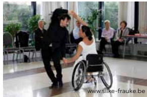
Danse en fauteuil