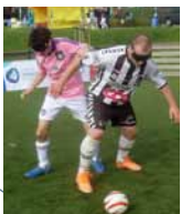
Football à 5