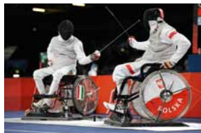
Escrime en fauteuil