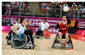
Rugby en fauteuil