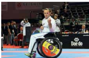
Karaté en fauteuil