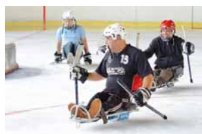
Hockey sur luge