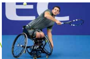
Tennis en fauteuil