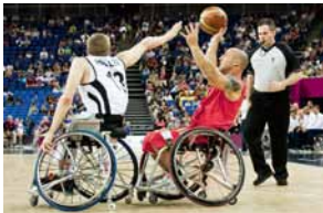
Basket-ball en fauteuil