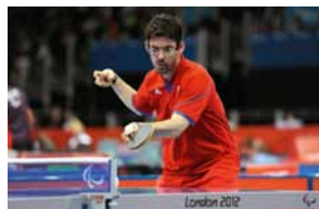
Tennis de table