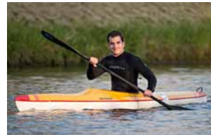
Canoë / Kayak