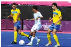
Football à 7